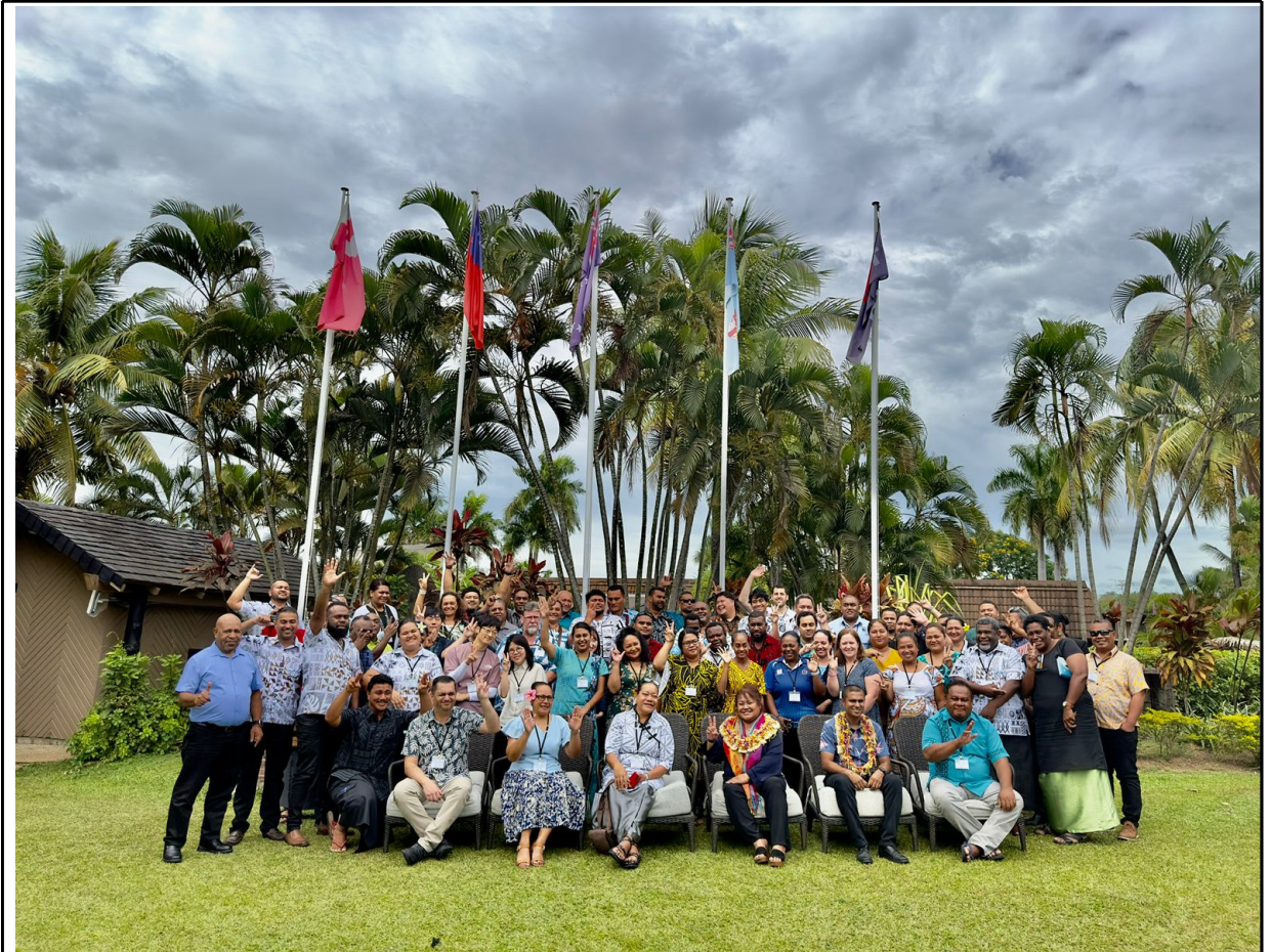
[PICOF-13 및 기후정보서비스 사용자포럼 참석자]