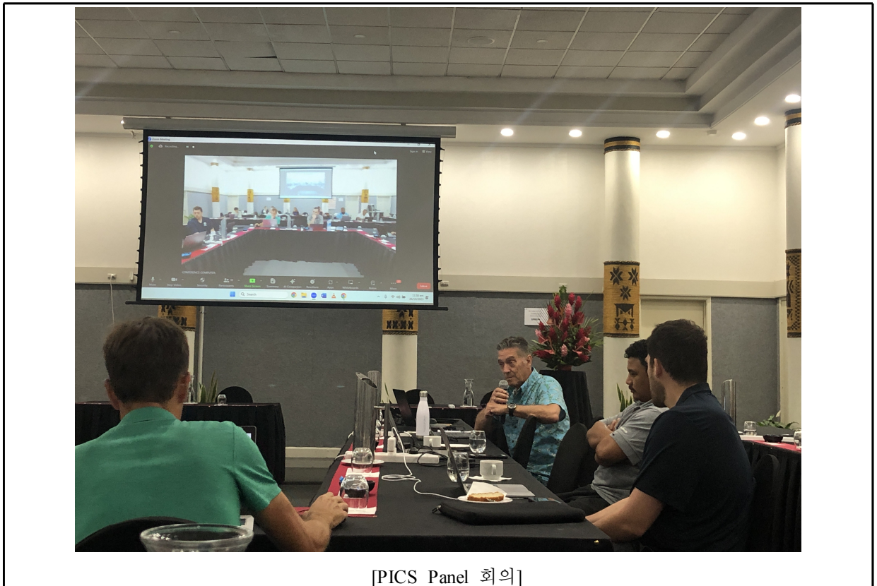
[PICS Panel 회의]